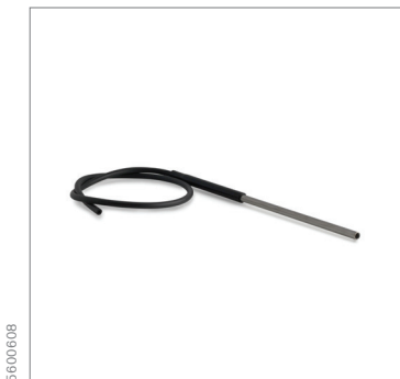
Sonde de gaz en alu Inclus cône, tuyau de 0,7 m (jusqu'à 200 °C)