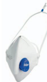
Dräger X-plore® 1720+ V