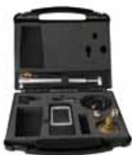
Messpaket Dräger P4000 3,5 bar: Handlich, vielseitig, hochwertig.