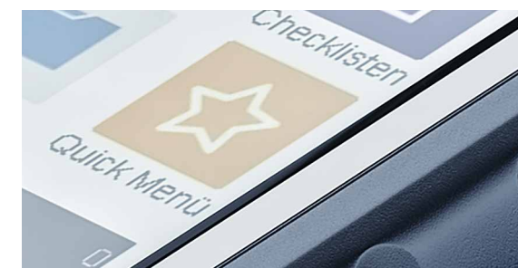
Quick-Menü: Hier werden nur die wichtigsten Werte der Abgasmessung aufgezeigt und es dient als Orientierungshilfe.