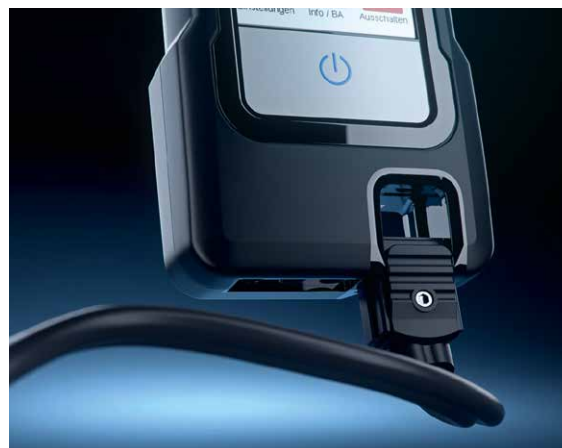
Ein neuartiges Stecksystem sorgt für einen schnellen Austausch der Sonden.